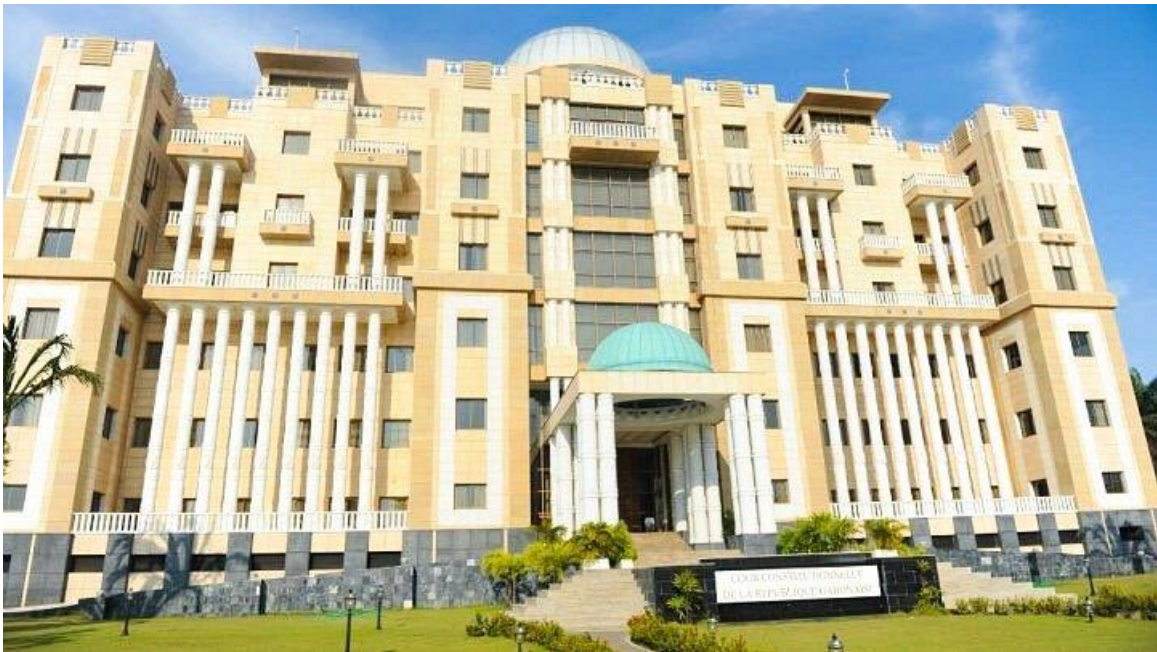
ဂါဘွန်သမ္မတနိုင်ငံဖွဲ့စည်းပုံအခြေခံဥပဒေဆိုင်ရာတရားရုံး ရုံးအဆောက်အဦ

ဂါဘွန်သမ္မတနိုင်ငံဖွဲ့စည်းပုံအခြေခံဥပဒေ (၁၉၉၁) ၊ အပိုဒ် ၈၃ အရ ဂါဘွန်သမ္မတနိုင်ငံ၏ ဖွဲ့စည်းပုံအခြေခံဥပဒေဆိုင်ရာတရားရုံး (Constitutional Court) သည် ဂါဘွန်သမ္မတနိုင်ငံ၏ ဖွဲ့စည်း ပုံအခြေခံဥပဒေဆိုင်ရာကိစ္စရပ်များနှင့် ပတ်သက်၍ အမြင့်ဆုံးတရားရုံး ဖြစ်ပါသည်။ ဂါဘွန်သမ္မတ နိုင်ငံ ဖွဲ့စည်းပုံအခြေခံဥပဒေဆိုင်ရာတရားရုံးသည် ဂါဘွန်သမ္မတနိုင်ငံ၏ ပြည်တွင်းဥပဒေများကို ဖွဲ့စည်းပုံအခြေခံဥပဒေနှင့် ညီ မညီ စစ်ဆေးစီရင်သည့်တရားရုံး ဖြစ်သကဲ့သို့ ဂါဘွန်သမ္မတနိုင်ငံ၏ ရွေးကောက်ပွဲများနှင့်ပတ်သက်၍ ရလဒ်ကို အတည်ပြုပေးသည့် တရားရုံးဖြစ်ပါသည်။