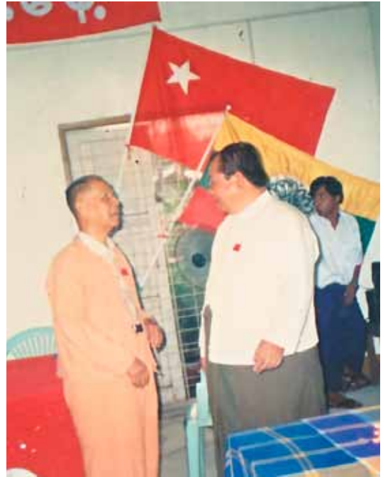
SNLD ဥက္ကဋ္ဌ ခွန်ထွန်းဦးနှင့်အတူ