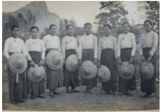
ရှမ်းပြည် အာရှလူငယ်အမျိုးသမီးအဖွဲ့