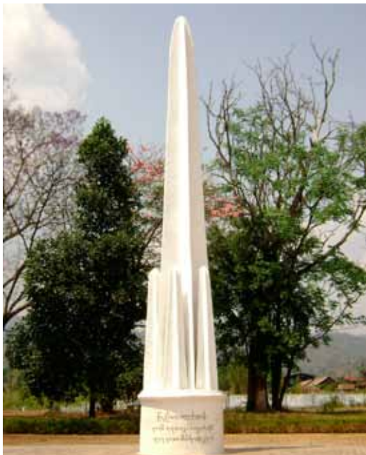
ပင်လုံကျောက်တိုင် (၁၉၄၇)