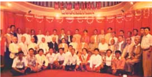
၅၁-နှစ်မြောက် ပြည်ထောင်စုနေ့ ညစာစားပွဲ