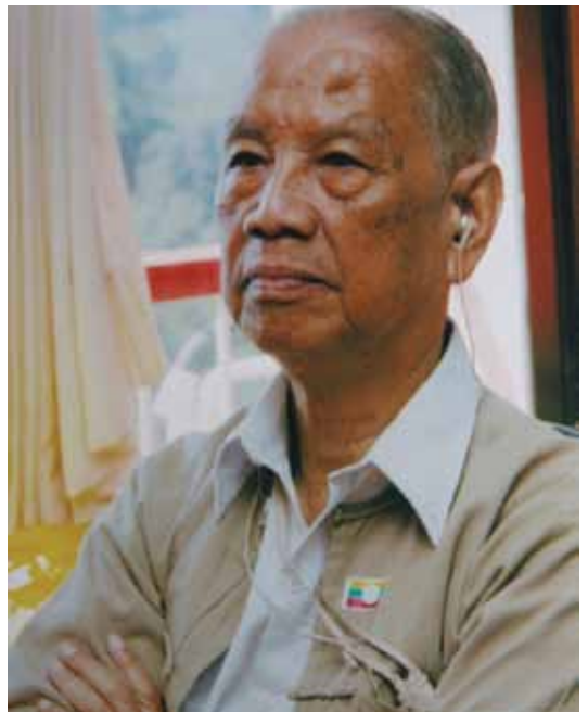
ထောင်ကြီးအသင်းနာယကတာဝန်ယူစဉ်