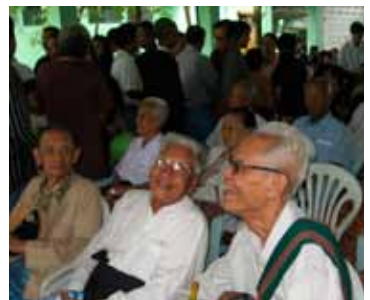
နောက်ဆုံးခရီးစဉ်ကို လိုက်ပါပို့ဆောင်သူများ