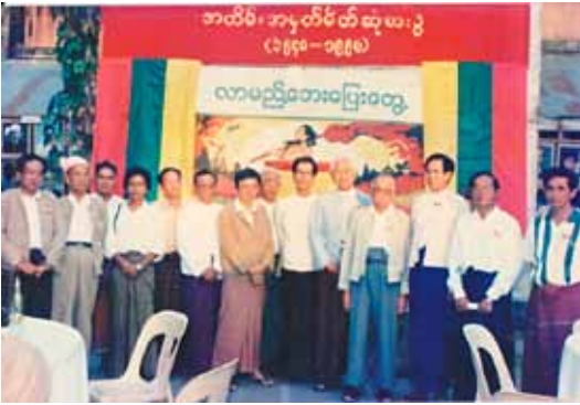
ဝါရင့်နိုင်ငံရေးလုပ်ငန်းကိုင်ပက်များအဖွဲ့၏ရွှေရတုလွတ်လပ်ရေးနေ့