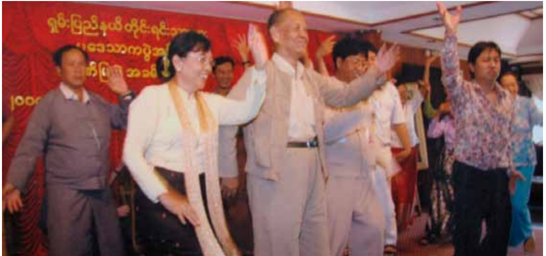
ရှမ်းတိုင်းရင်းသားပဒေသာကွဲတွင် အားတက်သရေပါဝင်ဆင်နွှဲနေစဉ်