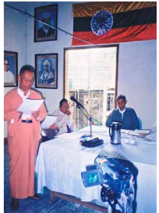
ဝါရင့်နိုင်ငံရေး လုပ်ငန်းကိုင်ပက်အဖွဲ့ အခမ်းအနားတွင် သဝက်လွှာ ဖတ်ကြားစဉ်