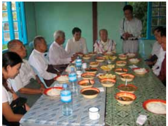
၂၀၀၉ ခုနှစ် ကူကီးအသင်းတော်တွင် ခရစ်မမတ် ညစာစားပွဲတက်ရောက်စဉ်