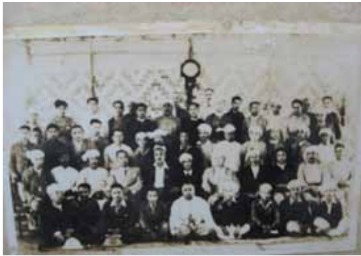
ပထမ ပင်လုံညီလာခံ (၁၉၄၆)