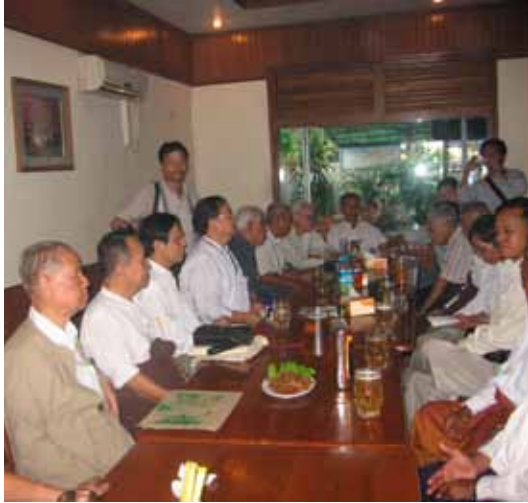
၆၁-နှစ်မြောက် ပြည်ထောင်စုနေ့ ညစာစားပွဲ