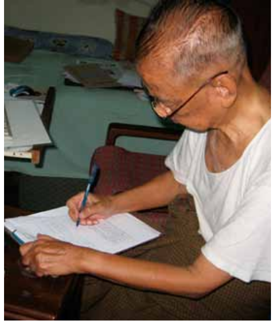
၂၀၀၇ ခုနှစ် မပြိုကွဲနိုင်သော ပြည်ထောင်စု စာအုပ်ကို ပြုစုစဉ်