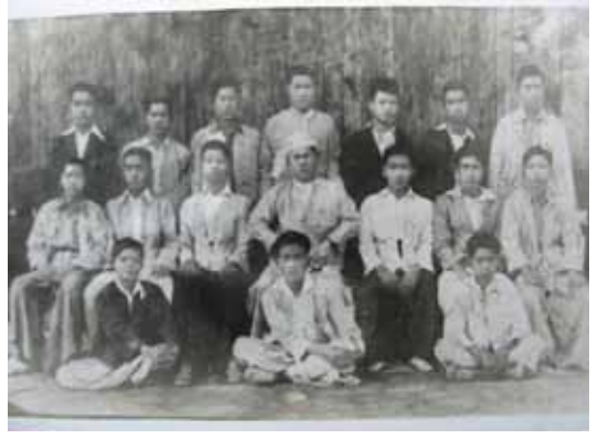
ညောင်ရွှေကျောင်းသားလူငယ်များ