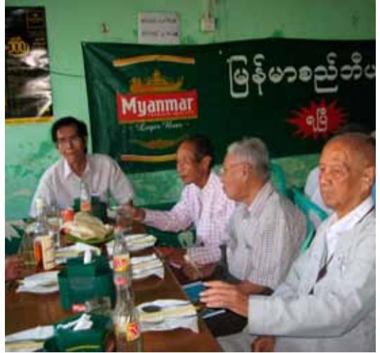
၆၂-နှစ်မြောက် ပြည်ထောင်စုနေ့ ညစာစားပွဲ