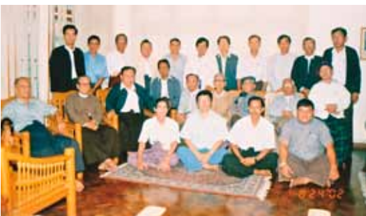
တိုင်းရင်းသားလူမျိုးစုများနှင့် ဝါရင့်နိုင်ငံရေးလုပ်ငန်းကိုင်ပက် အဖွဲ့ တွေ့ဆုံဆွေးနွေးပွဲ (ခွန်ထွန်းဦးနေအိမ်)