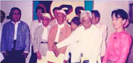
ဗိုလ်ညို၊ ပင်လုံဦးစွန်းထီး၊ ဦးရွှေအုံး၊ ဦးသာဘန်း၊ ဒေါ်အောင်ဆန်းစုကြည် (၅၁-နှစ်မြောက် ပြည်ထောင်စုနေ့)